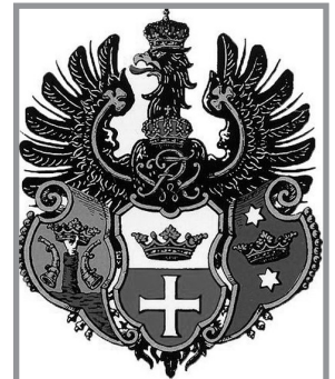
Герб объединенного города

Поселение, появившееся к востоку от основанного – Нойштадт (Новый город), названный позднее Лёбенихтом (город на Липовом ручье). Го-