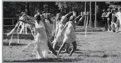
«Прекрасные дамы» не остались в долгу

лись со всех сторон, иногда получалось так, что непроизвольно начинаешь болеть за другую команду. – Кнайпхоф! – Лёбенихт! – Альтштадт! – А всё равно!