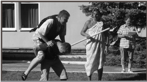
Трудна профессия коня

Так и в лагере два года подряд проводились рыцарские состязания: битвы подушками, бросание копья в мишень со спины «верного коня», перетягивание каната, борьба, стрельба из винтовки... В турнире командный дух был на первом месте, впрочем, отвага, упорство и находчивость также приветствовались.