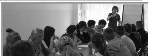
Тяжело в ученье...

он умрет от змеи, которая вылезет из его черепа.