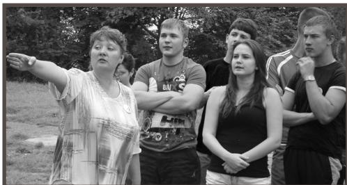
В эстафете участвовали все

Эстафета состояла из нескольких этапов. В ходе первого гильдиям предстояло ответить на вопросы на историческую тему: кто изобрёл первую в России подводную лодку или где находилась главная верфь Петра Великого. Второй этап напоминал школьные уроки ОБЖ, но, несомненно, был намного интереснее. На несколько минут актовый зал превратился в медпункт, где пяти членам каждой команды довелось пощеголять в только что наложенных повязках. Третья часть представляла собой полосу препятствий, которую следовало пройти за минимальное количество времени.