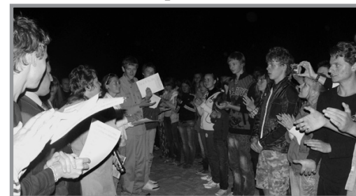
Посвящение – 2010

А сейчас – третий номер газеты «Замечтаешься».