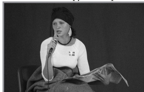
Швеция – «Секреты мастеров»

А вы знаете, как Рюрик со своими братьями делили Русь? А вы знаете, как звали человека, первым поселившегося в Исландии? А вы знаете, как реагируют финны на чёрную икру? Мы – знаем! На карнавале «Скандинавская сага» гильдии дали ответы на эти и многие другие вопросы.